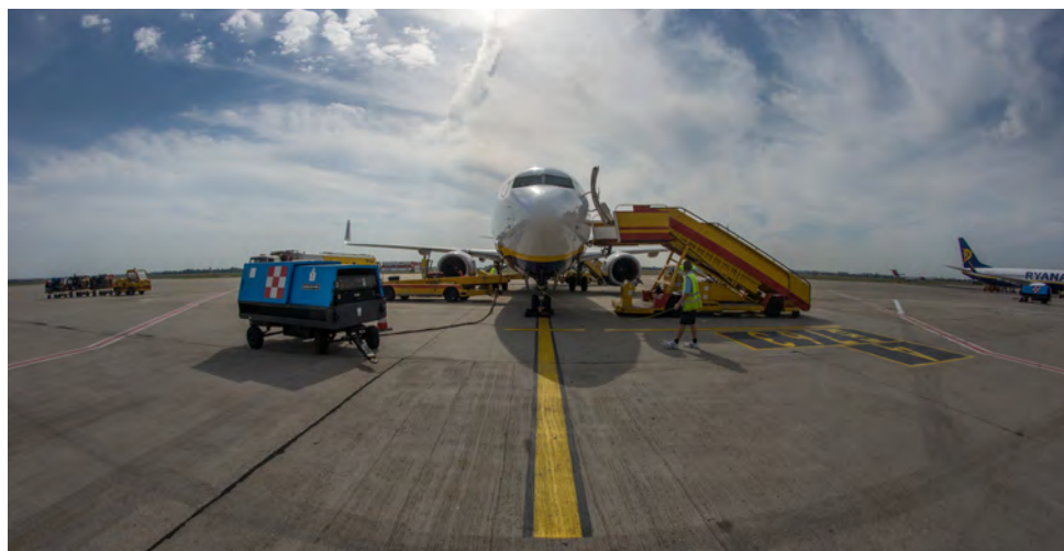
Pozemný zdroj elektrickej energie (modrý mechanizmus na fotografii)

Na žiadosť kapitána lietadla sa zabezpečuje i plnenie v požadovanom množstve (na bratislavskom letisku pôsobia dve spoločnosti, ktoré zabezpečujú komplexné služby spojené s plnením lietadiel). K lietadlu je pristavená cisterna, z ktorej sa cez hadicu doplní do lietadla letecký petrolej Jet A1.