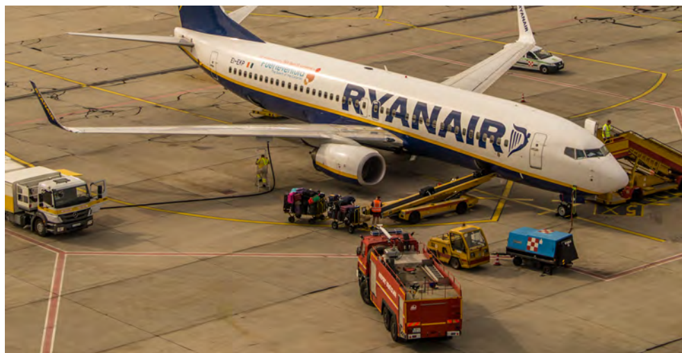
Nakladanie batožiny, dopĺňanie paliva

Nasleduje odstránenie zaistovacích klinov, vytlačenie lietadla zo stojiska (zasunutím a vyzdvihnutím predného podvozku) a postupné spustenie motorov. Pracovník ramp handlingu udržiava spojenie s kapitánom lietadla, pričom vodič ťahača sa riadi zásadné pokynmi ramp agenta. Po vytlačení lietadla je špeciálne letiskové vytlačacie vozidlo odňaté od lietadla, ramp agent signalizuje pokyn VOLNO kapitánovi lietadla a čaká na vyrolovanie lietadla.